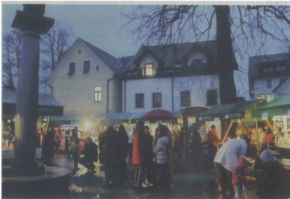
V Logatcu se na trgu pred cerkvijo sv. Nikolaja že vrsto let odvija Miklavžev sejem, ki ob nastopu večera dobi pravo praznično podobo.