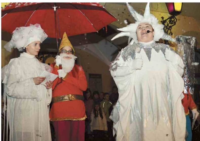
Teta Zima s snežinko in palčki je pred ptujsko Mestno hišo prinesla res razburljiv snežni metež pa tudi spodbudne besede za otroke. (Slavko Podbrežnik)

Ta dogodek je uvod v Ptujsko pravljico, kot so organizatorji poimenovali prvi božično-novoletni sejem v starem ptujskem mestnem jedru. V njegovo izvedbo so se poleg Mestne občine Ptuj (MOP) vključili Javne službe Ptuj, ptujška območna izpostava JSKD, Društvo prijateljev mladine Ptuj, Center interesnih dejavnosti Ptuj, Vrtec Ptuj in podravsko-ptujsko-oromoška Regionalna destinacijska organizacija (RDO). Odprt bo vsak večer med 17. in 31. decembrom s pričetkom ob 17.30.