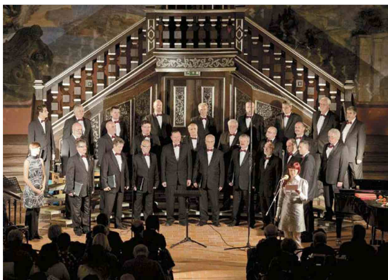
Nastop na sklepnem koncertu revije Sozvočenja v Ljubljani je za Vres velik uspeh.