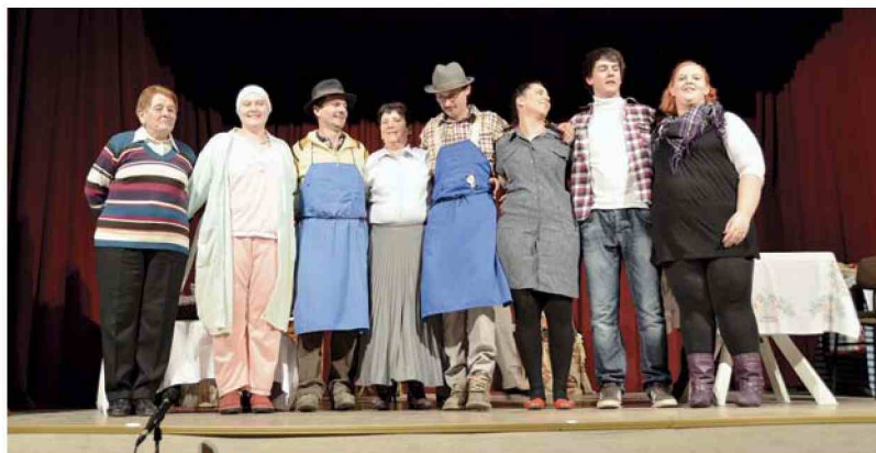
Tomaževski gledališčniki, nagrajeni z aplavzom nasmejanega občinstva (Arhiv KD iz Svetega Tomaža)

"Res imamo odlične pogoje. V sekciji dejavno sodeluje 15 članic in članov. Na vajah se dobivamo enkrat tedensko, ponavadi jih pričnemo v novembru in predstave končamo v marcu. V tej sezoni pripravljamo komedijo Moj Vinko , ki smo jo predstavili že lani v našem kraju in tudi v sosednjih občinah, saj je predstava zelo zanimiva. Publika privlači, ker je v prleškem na-